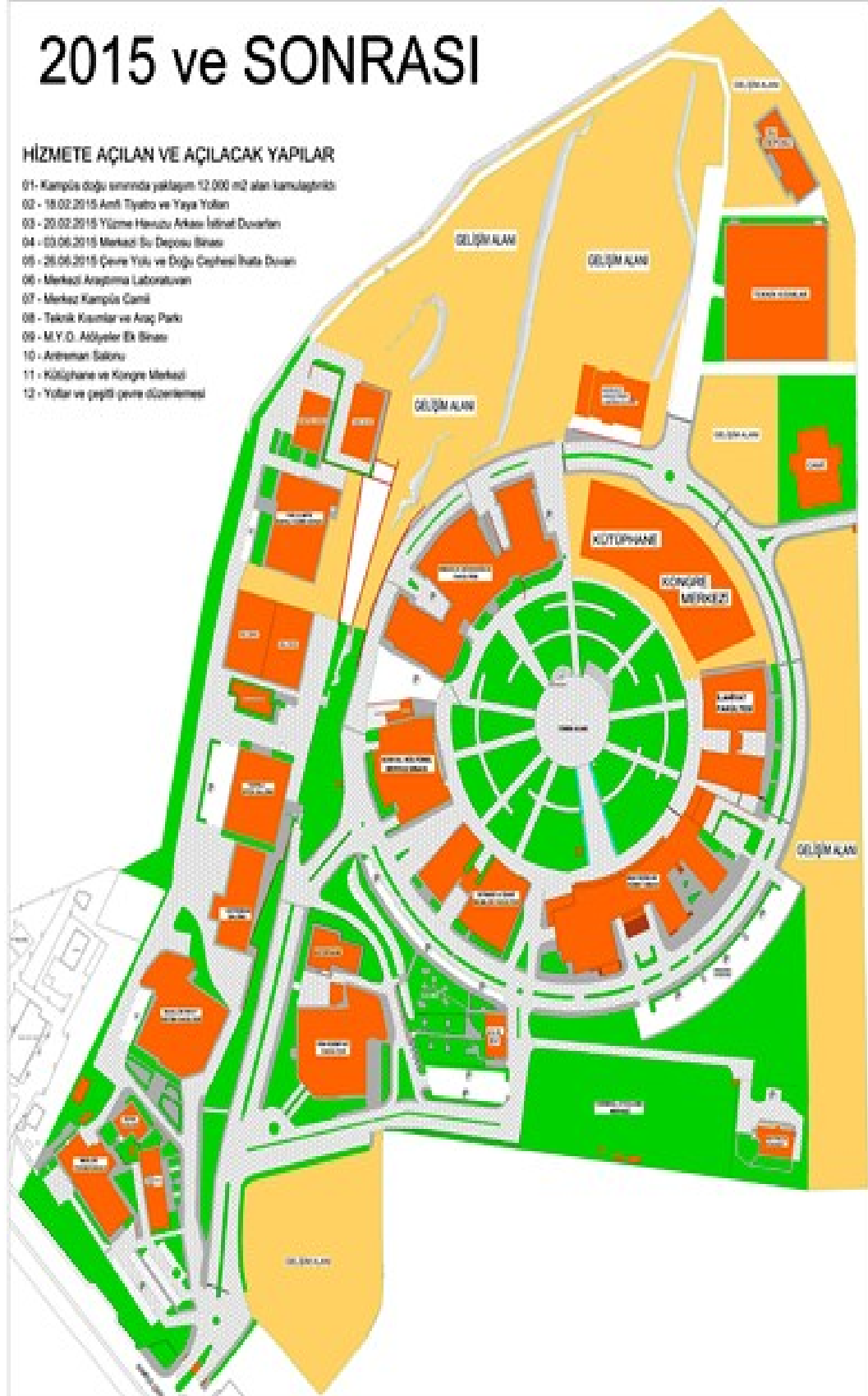
Şekil.1 Kilis 7 Aralık Üniversitesi Kampüs Planı